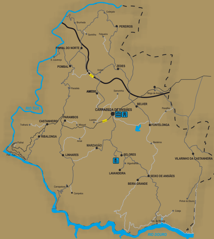
MAPA DO CONCELHO DE CARRAZEDA DE ANSIÃES MUNICIPALITY OF CARRAZEDA DE ANSIÃES MAP

LIT - Loja Interativa de Turismo/Interactive Tourism Shop Praça do CITICA 5140-085 – Carrazeda de Ansiães telf: 278 098 507 / www.cmca.pt Visitas Guiadas/Guided Tours - lit@cmca.pt 278 098 507